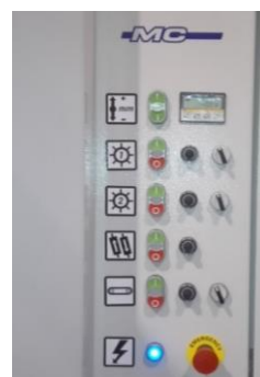
PANEL DE CONTROL / CONTROL MACHINE