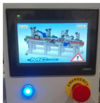
PANEL DE CONTROL/CONTROL MACHINE