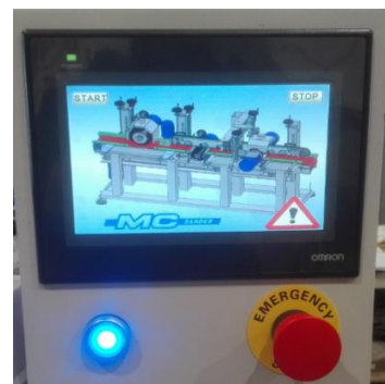
PANEL DE CONTROL/CONTROL MACHINE